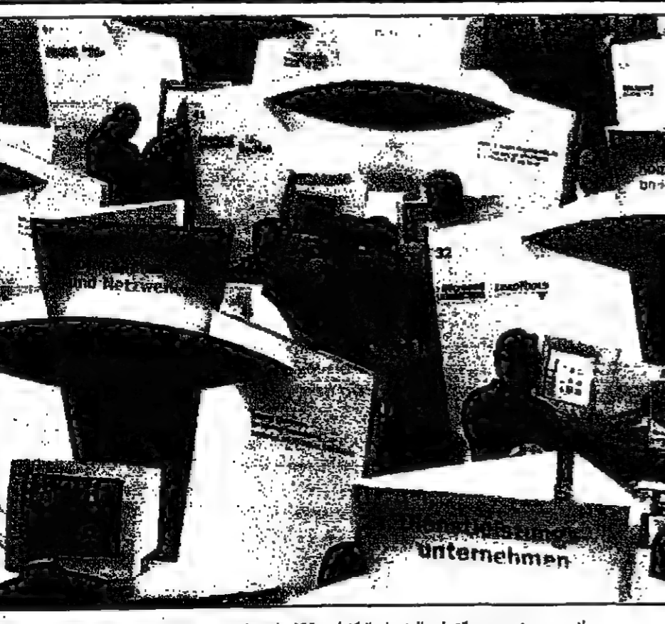
جانب من معرض سبيد التجاري للمنتجات التكنولوجية التي افتتح أمس في مدينة منور الألمانية

تونس تخفض مساحات زراعة الحبوب بنصف المساحة المقررة لهذا الموسم. ويرجع ذلك الى ارتفاع أسعار البذور وتوقع هبوط أسعار الحماضيات. ارتفاع إنتاج زيت الزيتون في تونس هذا الموسم، مما سيعزز مكانة البلاد كمصدر رئيسي للزيت في المنطقة.